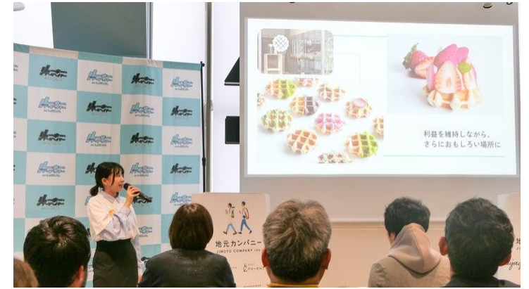
ローカルルーキーのプレゼンテーション 第一回大会 2024年in宮崎