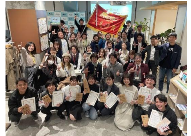
全国から集まったルーキーたち 第一回大会 2024年in宮崎